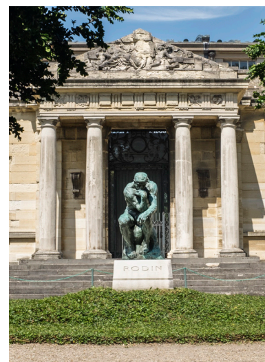
Albert Harlingue, Portrait de Rodin sur les marches de la Villa des Brillants , détail, 1899 © Musée Rodin Le Penseur sur la tombe de Rodin au musée Rodin de Meudon, © Agence photo du musée, J. Manoukian